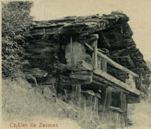
Châlet de Zermat

sem sedaj tu na juan. - vednica nekoga ženskega eista med je povabila na počitnice do njegove leta - a najbolj oči tudi potem se vstanem tu. - moj naslov? - Bellinzona - Bravechia, Villa belta vista danton Tessin, Evica. - št. poljubno in jednega! - Broj živi! svoja